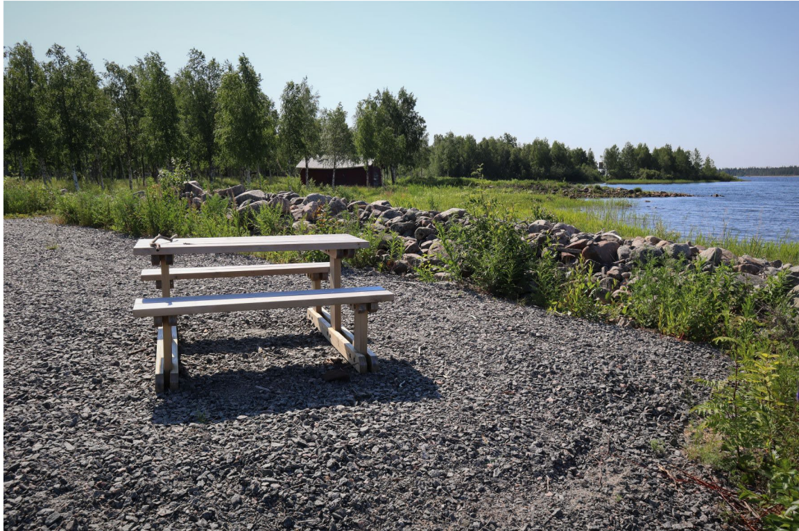
3) Niemenkärki, jossa rantaheinää, lehtimetsää ja vanha rakennus.